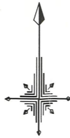
境界点座標一覧表